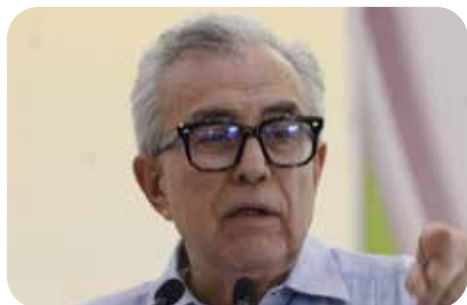
Rubén Rocha Moya