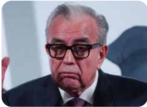
Rubén Rocha Moya