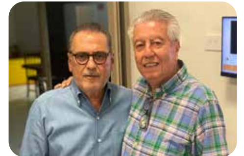
Manlio Fabio Beltrones con el columnista.

Mientras que a la militancia de Morena y partidos aliados le inspiraba respeto por su entrega a las causas de equidad cívica y social, a los miembros de la oposición con frecuencia les hacía pensar o presagiaba tiempos de tempestad. Cuando ANDRÉS MANUEL LÓPEZ OBRADOR le dio su confianza y amistad, RUBÉN ROCHA MOYA era senador electo de la República, por el periodo de 2018-2024.